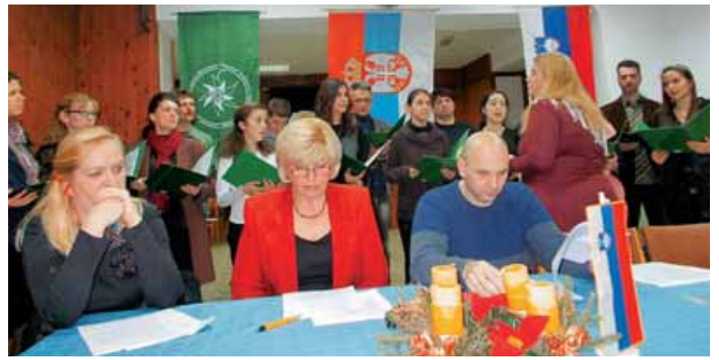
Občni zbor društva Planika

V uvodnem pozdravu je predsednica najavila Miklavžev prihod in obdaritev pridnih otrok ter dodala, da je tudi letošnje obdaritev omogočil velikodušni prispevek marijorske nadškofijske Karitas. Nato je zbor Planika zapel nekaj slovenskih pesmi. Tedaj je zvonec naznanil, da prihaja sveti Miklavž. Dvorana je bi-