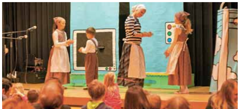
Otroci so navdušili zbrane.

13. decembra so se učenci dopolnilnega pouka slovenščine s starši in pri-