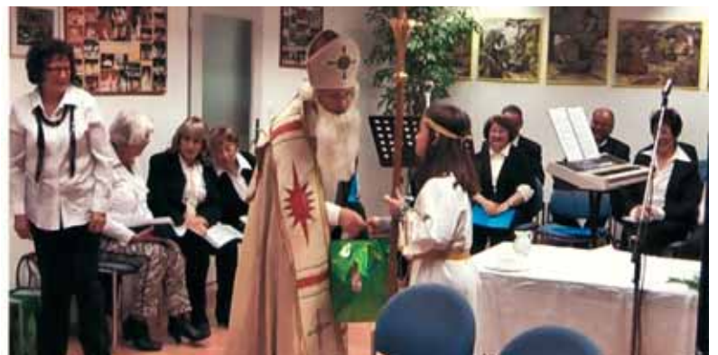
Tudi angelček je v Augsburgu prejel darilo.

nesmrten. Po maši so v dvorani sv. Miklavža nestrpnost čakali tako otroci kot tudi odrasli. Naenkrat je glas zvončkov v rokah angelskih spre-