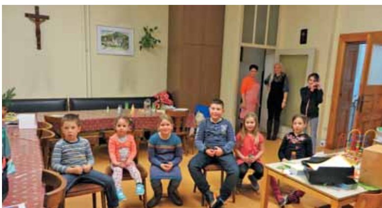
Slovenski otroci po maši