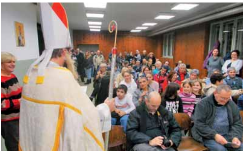
Miklavž nagovarja zbrane