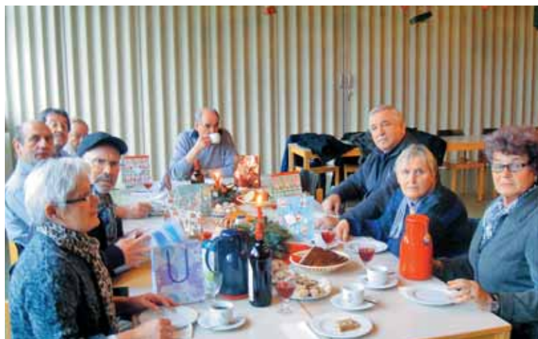
Zajtrk na Miklavževo nedeljo v Lichu