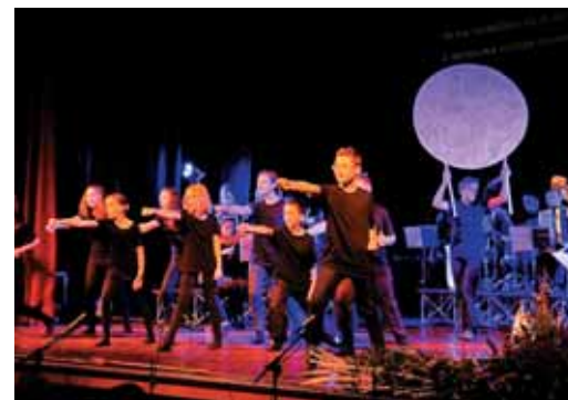
Nastop mladih