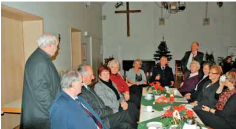
Tudi po maši se imamo tudi lepo.