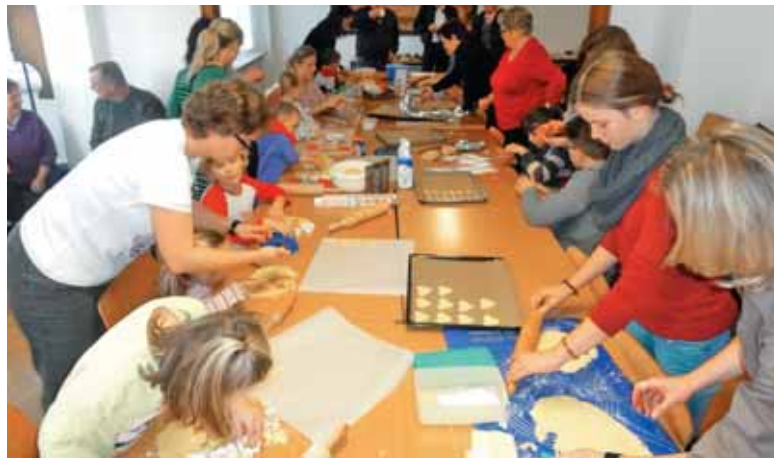
Adventne delavnice s piškoti

V začetku meseca decembra, ko praznujemo god svetega Miklavža, smo v naši župniji v Stuttgartu in po podružnicah v Böblingenu, Pfullingenu in Heilbronn zelo slovesno praznovali god tega velikega krščanskega svetnika. Na začetku smo imeli skupaj sveto mašo, pri kateri se je zbralo lepo število naših ljudi, ki so po molitvi in mašni daritvi prosili božjega blagoslova za naše življenje. Nato smo se preselili v dvorano pri cerkvi in ob skupnem druženju čakali prihod svetega Miklavža. Otroci in starši so pripravili tudi krajši kulturni program, ki je vsem nam obogatil naše skupno praznovanje. In nato je med nas prišel sveti Miklavž skupaj s svojim angelom in dvema parkljevma, ki sta nagajala njemu in nam vsem. Sveti Nikolaj je najprej nagovoril vse navzoče, še posebej pa otroke in njihove starše. Skupaj smo zmolili nekaj molitev. Koš z darili, ki so čakali pridne otroke, se je povsod hitro spraznil. Vsako leto je Miklavžev-