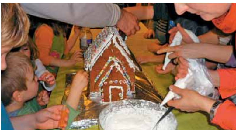
Priliti bo treba še nekaj smetane, ker jo je preveč ostalo na prstkih in sladkosnednih jezičkih!