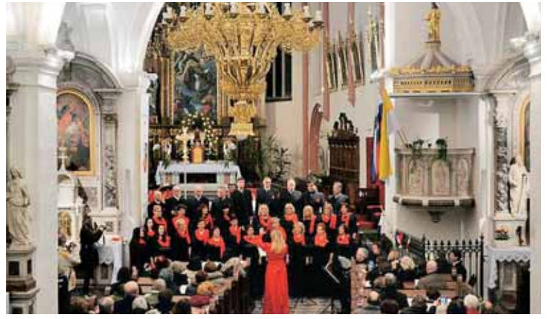
Božični koncert Encijana v prelepi cerkvi sv. Nikolaja v Novem mestu

Če se vrnem še v mesec november: 5. novembra je bilo odprtje fotografske razstave Alojza Orla v naši društveni galeriji in še na 45 različnih mestih v Pulju. Ta ogromen opus je zapustil fotograf, Slovenec, ki je deloval v Pulju pol stoletja. Razstava je imela humanitarni značaj. Izkupiček od prodaje fotografij je bil namenjen za prenovo oddelka psihiatrije v puljski bolnišnici. Sama razstava je bila na ogled do 19. novembra.