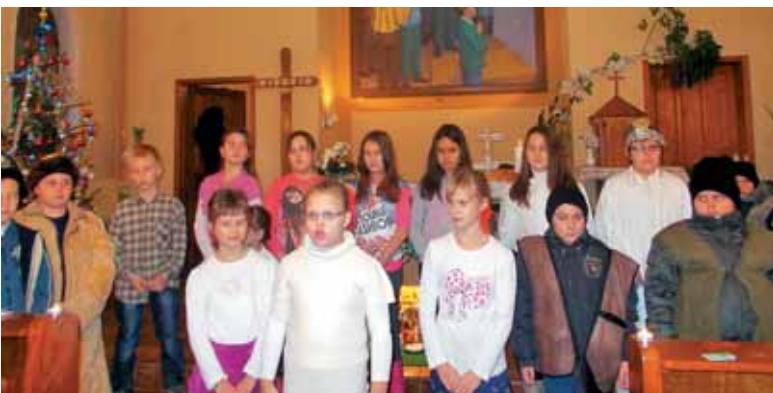
Betlehemeši so uprizorili božično igrico.