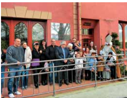
Nekateri otroci in starejši so pospremili sv. Miklavža pred odhodom z misije v Merlebachu.