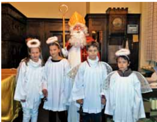
Miklavž z angelčki v Berlinu