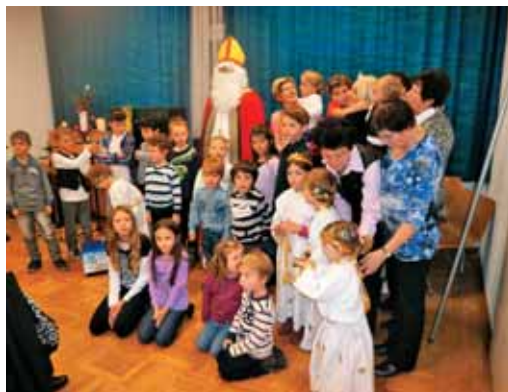
Miklavž v Ravensburgu sredi otrok