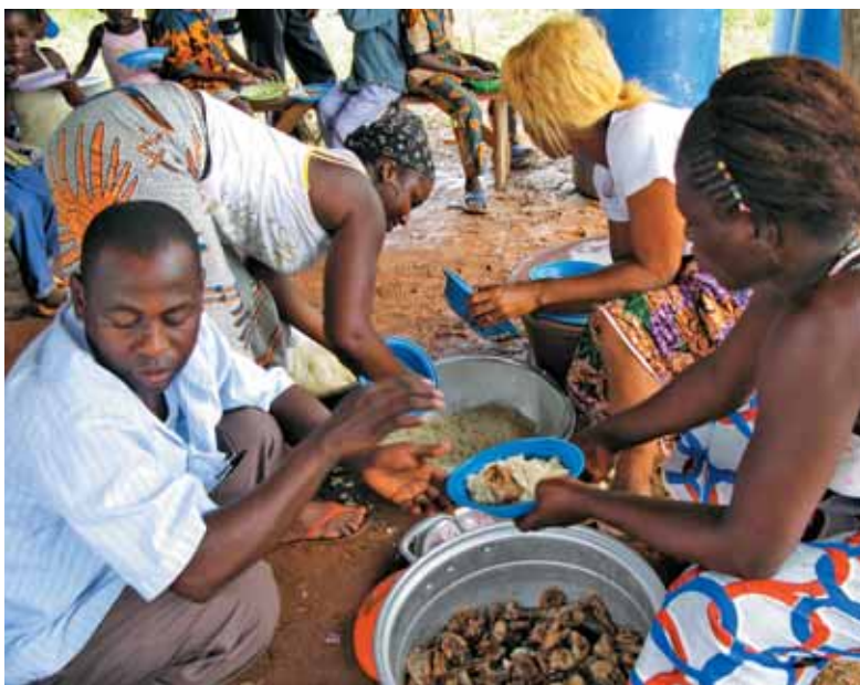
Razdelitev šolske malice

Ne, je več kot to, je hujše. Je hudič. Ljudje sami ocenijo, da tega sam človek ni zmožen, to je delo