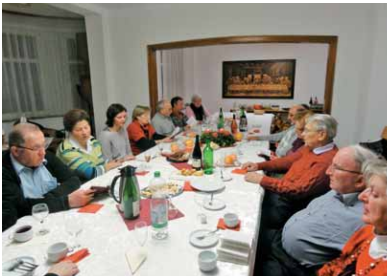
Zaključek pevskih vaj zbora Obzorje