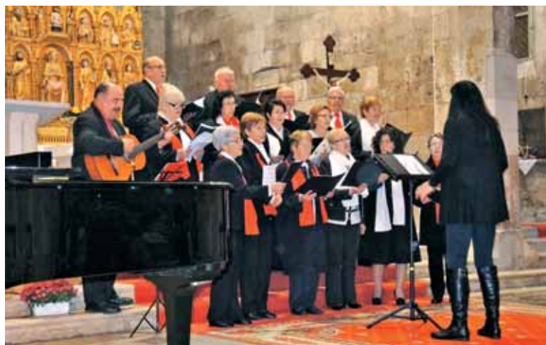
Cerkveni pevski zbor župnije sv. Lovra v Premanturi na praznik sv. Cecilije

Tudi kreativke SKD Istra Pulj so se pridružile temu doživljanju svetlobe z izdelavo domačih adventnih venčkov, božičnih čestitk, okraskov za božično drevo in jasic iz gline. Ročno izdelani adventni venec krasi tudi Slovenski dom v Pulju, kjer je prva prižgana sveča ustvarila posebno vzdušje in luč ljubezni v prostoru kot v vseh srcih članov, ki dom obiskujemo in v njem delujemo.