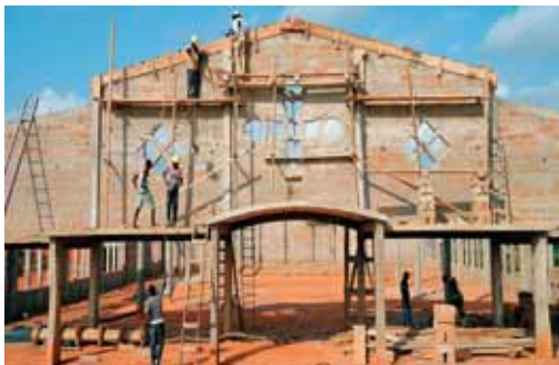
Gradnja cerkve v Gabiadji

hudiča. Čarovništvo je hudič. Pogan je egoist. In hudič je to. Naj spomnim samo na pojem afriška solidarnost. To je popolnoma prazna beseda. Je kvečjemu neka nizka stopnja medsebojne pomoči, kjer se da doseči korist v obe smeri. Deluje samo v klanu. V širši družbi nikakor, je le mit.