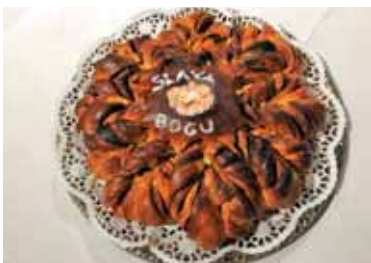
»Naš vsakdanji kruh«

Kolikor je bilo mogoče, se je slovenski dušni pastir ustavil tudi ob lepih jaslicah v Eskilstuni, ki vselej nagovorijo obiskovalce tega lepega božjega svetišča. Jaslice so narejene z veliko ljubeznijo in skrbjo, saj so tamkajšnje sestre tiste, ki jih postavljajo. Toliko je prošelj, toliko je zaupanja