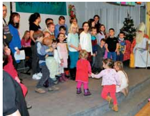
Otroci pred Miklavžem v Frankfurtu