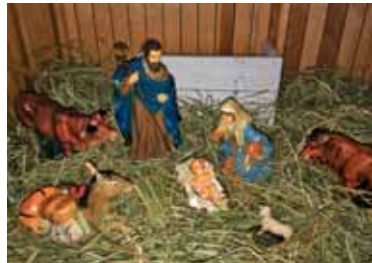
»Jezušček na slamicí«

Štefana za zdravje pri ljudeh in pri živini, ter vino na čast sv. Janezu, da bi ta dobrina ne bila strup v medsebojnih odnosih, ampak da bi vselej razveseljavala človeška srca.