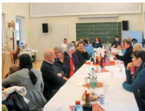
Miklavž nagovarja prisotne v Mainzu.