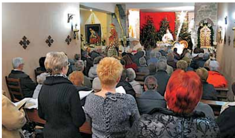
Zbrani ob Novorojenem na božični večer v Merlebachu