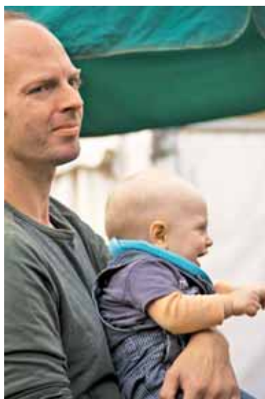
Veselo in varno v naročju svojega očeta

Tretja in četrta adventna nedelja. Na tretjo adventno nedeljo (14. decembra) smo imeli posebno slavnost v Eisdnu, kjer je bila ob 10.30 sveta maša skupaj s flamsko skupnostjo, pri maši je prepeval združeni zbor Slomšek. Po maši je sledil kratek koncert božičnih pesmi. Nato smo bili povabljeni na slavnostno