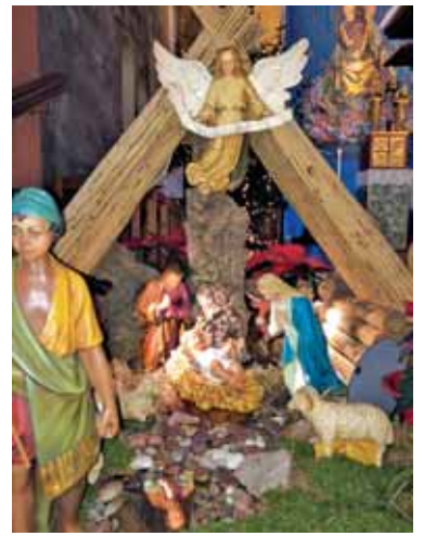
Slava Bogu na višavah in na zemlji mir ljudem

Na sveti večer so se rojaki iz Göteborga ob 21. uri zbrali k slovenski polnočnici v dvorani Janeza Pavla II. Nekaj družin, celo gostje iz Avstrije in Prekmurja, se je zbralo k svečani polnočnici, kjer so odmevale prelepe božične pesmi, ki so kot balzam mazilile srca rojakov. Jezus v jaslicah je vse navzoče povabil, da se zazrejo, kot je rekel papež Frančišek, v otroke tega sveta. Papež Pavel VI. pa je povabil vse navzoče, da se zazrejo v sveto družino, kjer imajo očetje v sv. Jožefu, matere v sv. božji Materi, otroci pa v Jezusu primer, kako živeti v družinskem okolju, da bodo vsi srečni, blagoslovljeni, da bo vsak