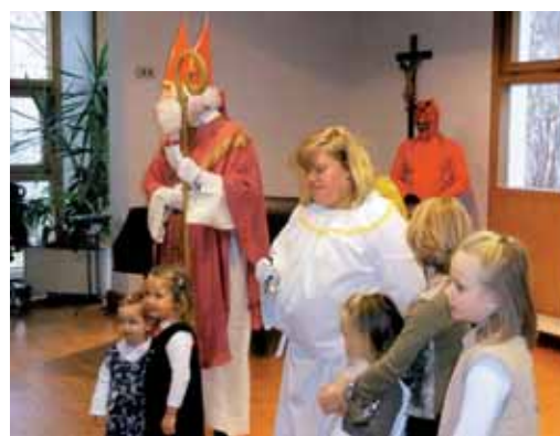
Miklavž ni pozabil na vernike v Böblingenu.