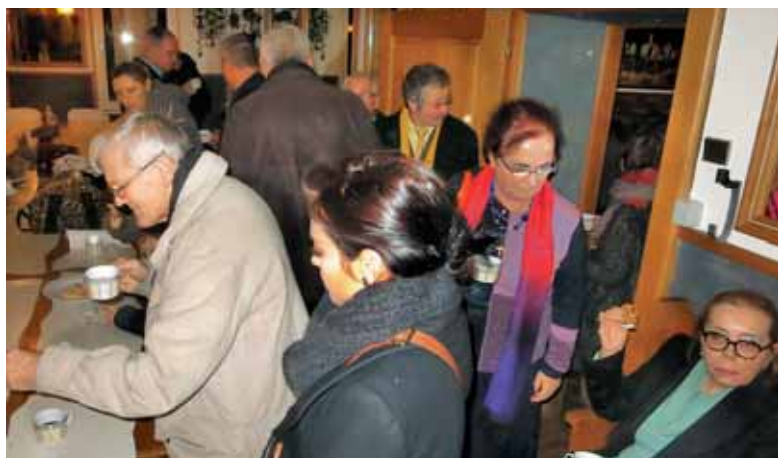
Na božični večer še kuhano vino in domače pecivo za vse navzoče

skov. Pozdravil nas je prisrčno z besedami »nasvidenje prihodnje leto«. Razšli smo se veseli ob lepo preživeti nedelji, prepojeni z bogatimi trenutki dneva. Za tem praznovanjem so nam zdrsnili decembrski dnevi, obarvani z veselim pričakovanjem Gospodovega rojstva.