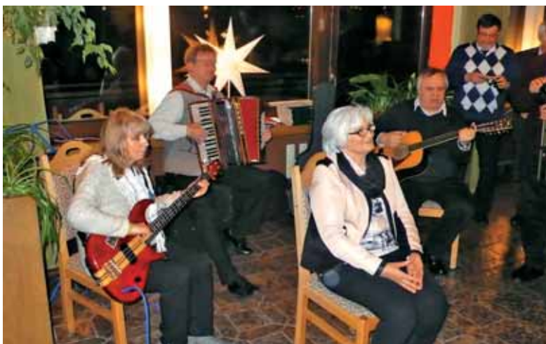
Slavljenka je pazljivo poslušala, kar so ji recitali in zapeli.

mljevalcev naznanil, da je težko pričakovani dobrotnik pred vrati. Ko je vstopil v dvorano, so se vsi umirili. Spoštljivo je vse lepo pozdravil, nato pa, kot je v navadi, najmlajše in vse pridne obdaril. Ob odhodu je obljubil, da bo prihodnje leto spet prišel.