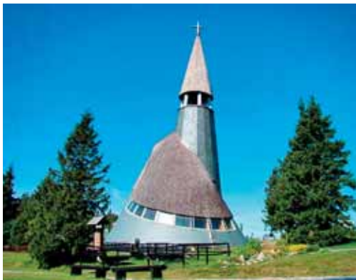
Cerkev Gospodovega spremenjenja na gori