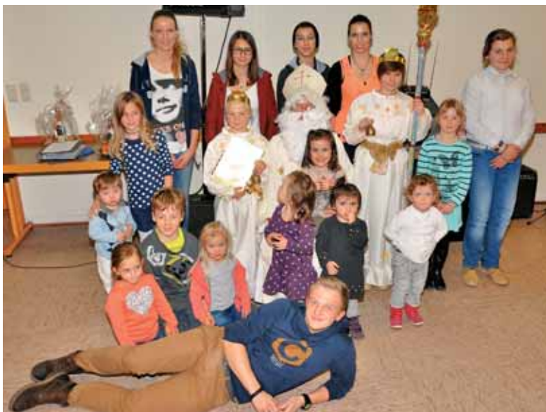
Miklavževanje v Moersu