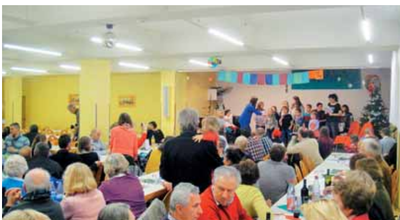
Miklavževa nedelja v dvorani v Frankfurtu