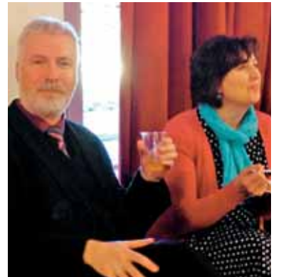
Vsak delavec je vreden svojega plačila.