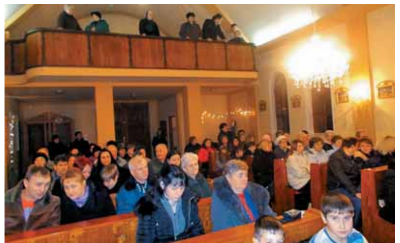
Polnočnica je bila lepo obiskana.