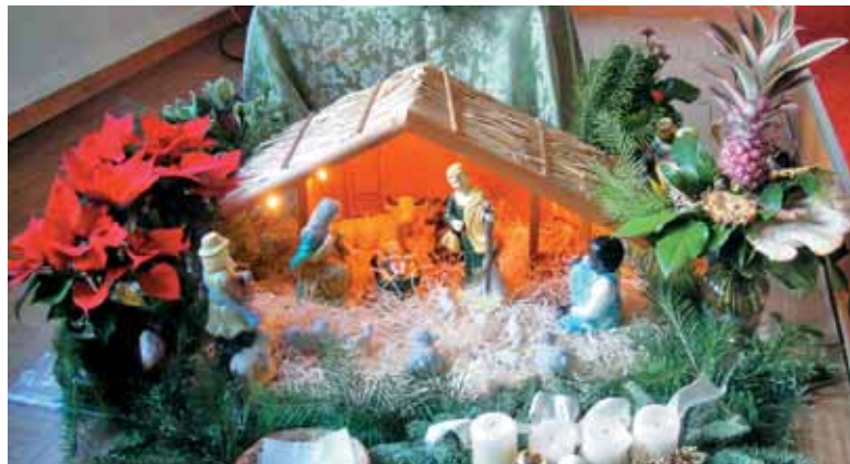
Jaslice v Darmstadt, kapela hrvaške župnije

vrsto let pripravili kosilo oziroma nekakšno adventno srečanje po nedeljski maši, ki je trajalo kar nekaj ur. Vsekakor je bilo lepo in prijetno tako v Mainzu kot Frankfurtu.