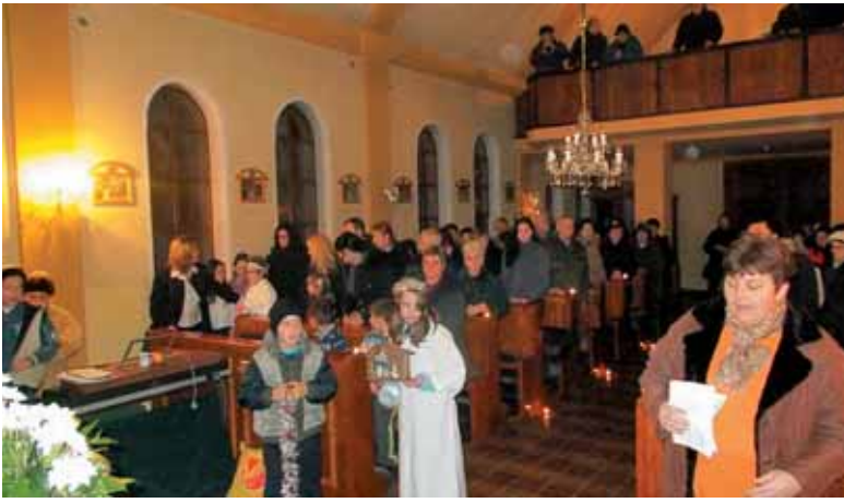
V cerkvi svetega Dominika na Peskari