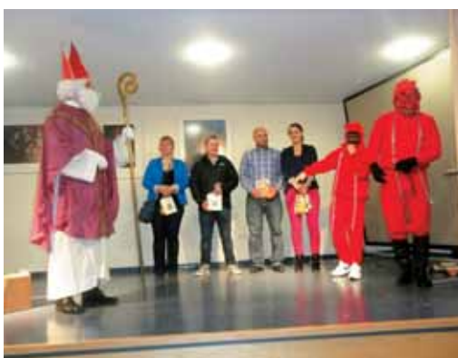
Miklavž v Stuttgartu v spremstvu strašnih parkeljnov