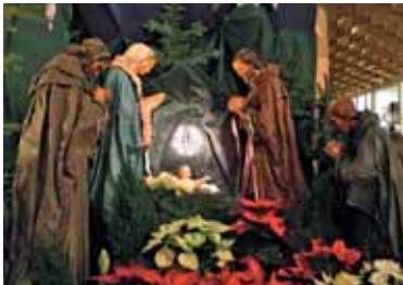
»Molim Te ponižno ...«