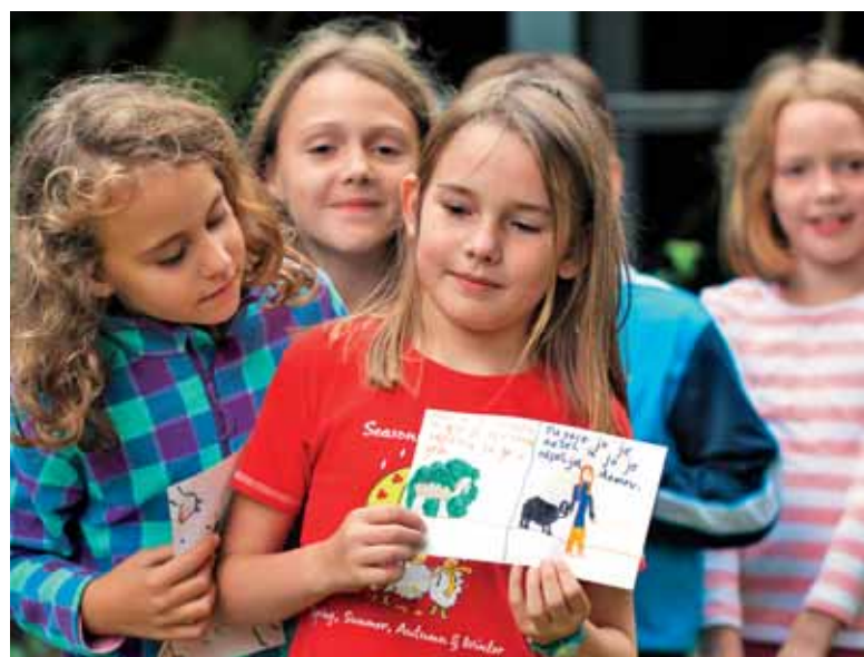
Jezus je prišel kot dobri pastir.

kosilo, s katerim je zbor Slomšek priredil tradicionalno adventno in predbožično druženje. Popoldne je bila zelo obiskana slovenska maša v hišni kapeli v Slovenskem pastoralnem centru v Bruslju. Podoživljali smo Miklavžev večer, ki je nedeljo prej številnim otrokom prinesel veliko veselja. Adventni čas je čas pričakovanja, božični pa čas veselja in zaupanja. Tako kot je otrok varen v naročju svojega očeta (slika to dobro pokaže), se tudi mi ob božiču izročimo rokam božje previdnosti. Prosimo za dar vere in zaupanja, da bi Boga med nami znali ustvarjalno doživljati kot Pastirja našega življenja. Slika prikazuje ustvarjalnost otrok, ki jih nedeljski evangeliji nagovarjajo in iz njih izvabljajo veselje do življenja in do prijateljstva z Jezusom (to nazorno pokaže risba o dobrem pastirju). Na četrto adventno nedeljo so se nekatere družine iz Bruslja in Luksemburga že odpravljale na pot v Slovenijo ali kam drugam za božične in novoletne počitnice. Zato smo četrto svečo na adventnem vencu prižgali v manjšem krogu.