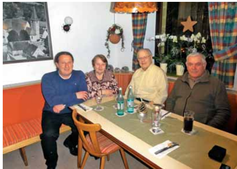
V Aalnu je vedno lepo.