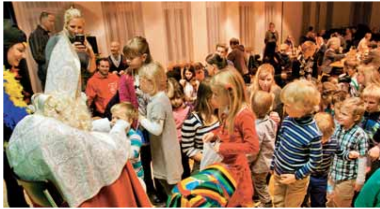
Sv. Miklavž je obdaroval prav vse otroke.