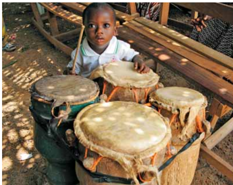
Ko bo velik, bo mojster.