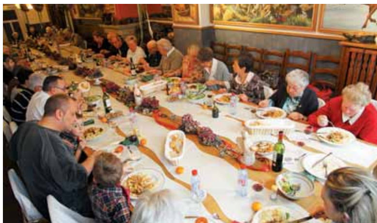
Miza prijateljstva na slovenski misiji v Merlebachu