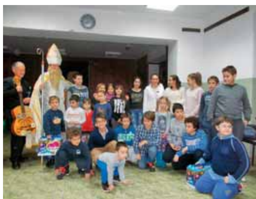
Miklavž je obiskal tudi otroke v Vojvodini.