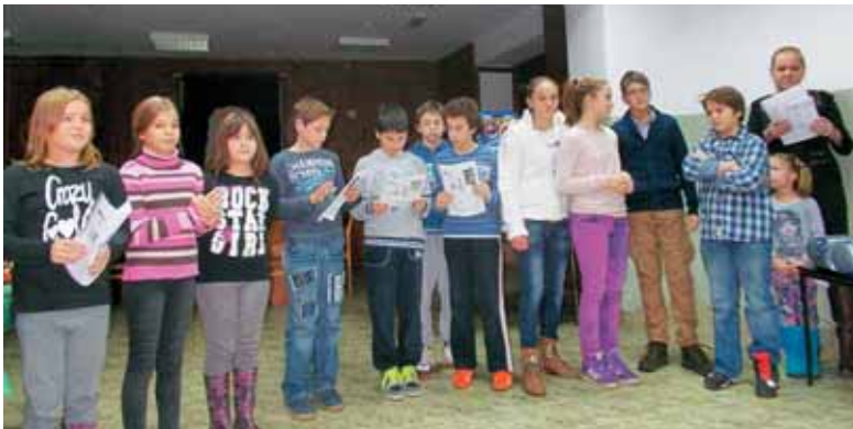
Miklavževanje v slovenskem društvu »Planika« v Zrenjaninu v Vojvodini

Slovenska polnočnica – kot že omenjeno – je bila slovenska maša