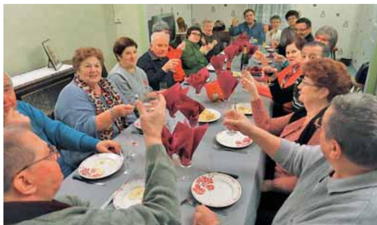
Praznovanje sv. Barbare v župnijski dvorani v Méricourtu