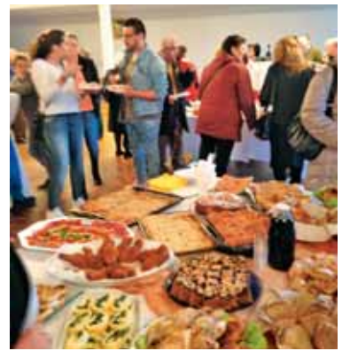
Slovenske dobrote so razveselile vse navzoče.

Darovanje kruha, ki ga vsaka skupnost prinese in položi pred oltar, je nekaj posebno zgovornega. Kruh, ki ga imamo sami, naj bo tudi kruh za druge. Tudi tema srečanja je bila: »Ljubi svojega bližnjega kot samega sebe.« Po sveti daritvi so bili vsi navzoči povabljeni, da okusijo specialitete sodelujočih držav. Italijani prinesejo različne pice, salame, pršut. Španci tortilje, šunko, corizo. Portugalci ba-