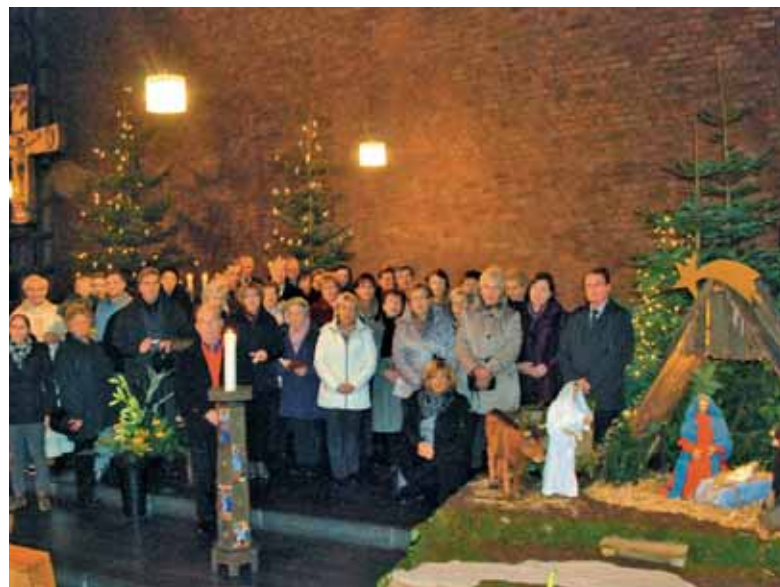
Hilden, božič 2014