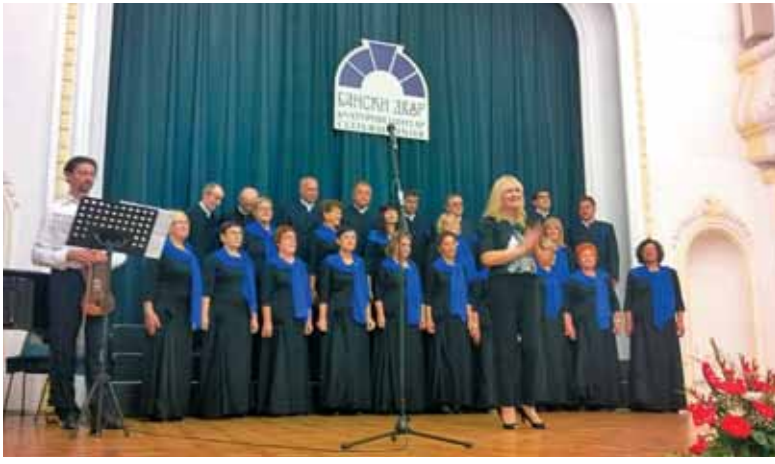
Encijan v Banskih dvorih v Banjaluki