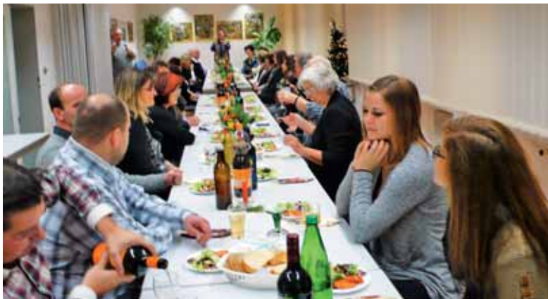
Na božičnici v Augsburgu