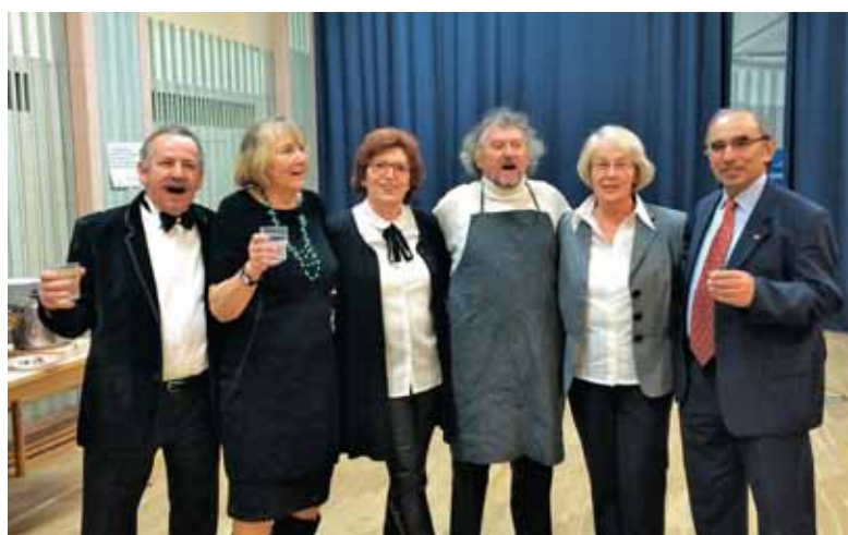
Slavljenki v decembru